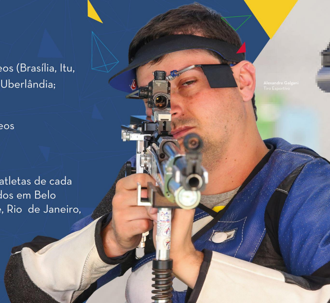
Alexandre Galgani Tiro Esportivo